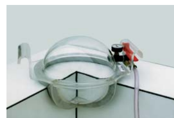
vnitřní roh 5/8 obědnávací č. 5200325