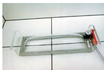
700x220 mm dlouhá obědnávací č. 5200300