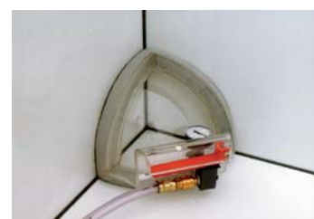
vnitřní roh dole 1/8 obědnávací č. 5200310

Všechny zkušební zvony dodáváme i v třídě přesnosti 1.0.