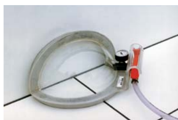
koutový svar uvnitř 2/8 obědnávací č. 5200315

Všechny zkušební zvony dodáváme i v třídě přesnosti 1.0.