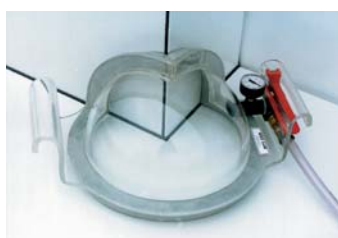
vnější roh dole 3/8 Obědnávací č. 5200320