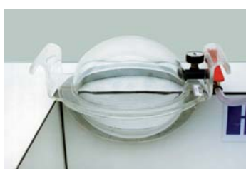
vnější hrana 6/8 Obědnávací č. 5200330