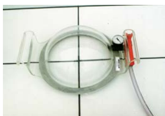
360 mm kulatá obědnávací č. 5200305