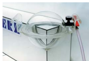
vnější roh nahoře 7/8 Obědnávací č. 5200335